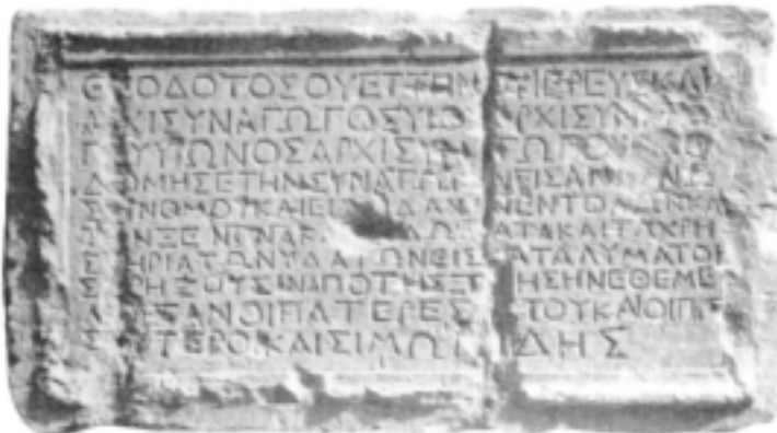
Gerusalemme – Iscrizioni dedicatoria di una sinagoga dell'Ophel.